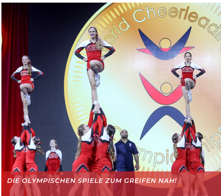
DIE OLYMPISCHEN SPIELE ZUM GREIFEN NAH!

Vereinsübergreifende Zusammenarbeit und (inter)nationale Vernetzung sind die grundlegenden Bausteine der Gremien. Du möchtest mehr darüber erfahren und wissen, wie die Gremien funktionieren? Seite 4!