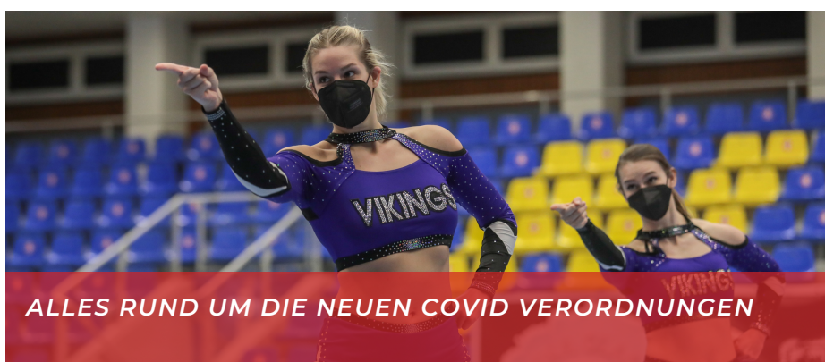
ALLES RUND UM DIE NEUEN COVID VERORDNUNGEN

Hier findest du das Formular zur Voranmeldung für die Sichtungstrainings 2021. Vorallem freuen wir uns über Bases und Backspots der Jahrgänge 2007-2010!