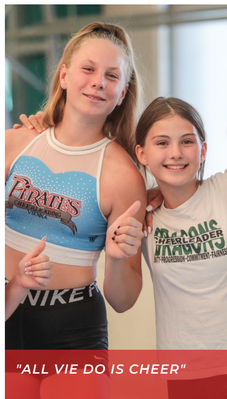
"ALL VIE DO IS CHEER"